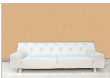
Votre mur initial