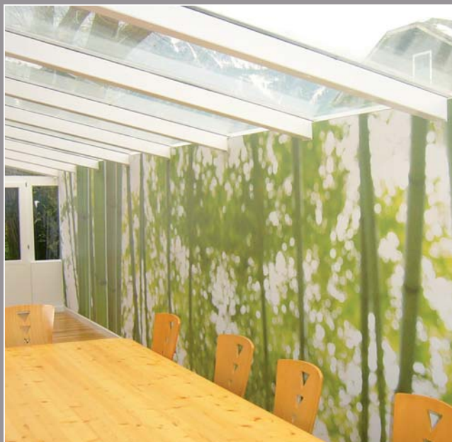
Salle à manger - Suisse (mur imprimé) Réalisation : Fontannaz W et PH Décoration

Répondre aux besoins du présent tout en préservant les générations futures est un défi majeur que le groupe clipso s'attache à relever en fabriquant des matériaux durables et performants , tout en réduisant au maximum leur empreinte écologique et en préservant la qualité de l'air , et ce tout au long de leur cycle de vie. La gestion de l'environnement passe par différentes étapes, depuis la production, en passant par le transport, la mise en oeuvre et le recyclage.