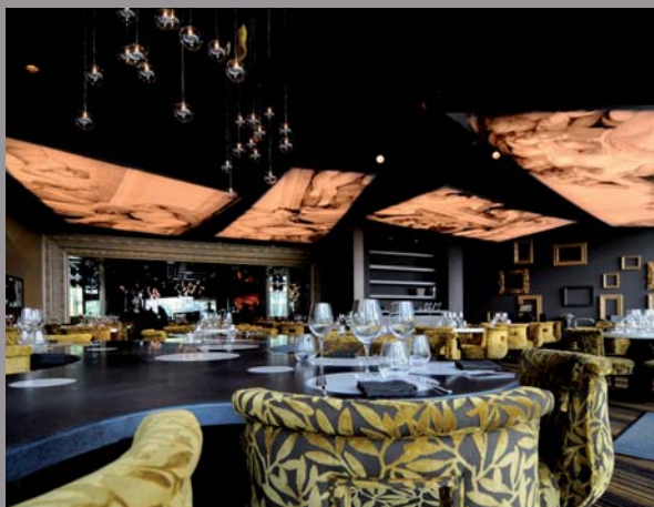
The Last Supper - Luxembourg (cadres imprimés) Architecte : Miguel Cancio Martins - Réalisation : Bert' Déco