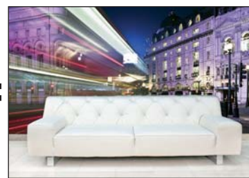
Votre mur final