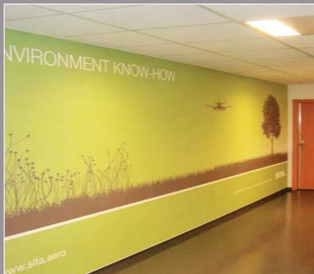
Entreprise SITA - Suisse (mur imprimé) - Réalisation : Reflecta

Pour finir, la plus grande valeur ajoutée était de pouvoir projeter l'image de la société à travers son environnement. Dans le passé, c'était un investissement couteux et contraignant, mais aujourd'hui c'est définitivement résolu avec clipso .