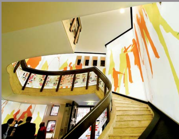
Twynstra Gudde - Pays-Bas (mur imprimé rétroéclairé) Architecte : Kubik - Réalisation : I-OMS NL