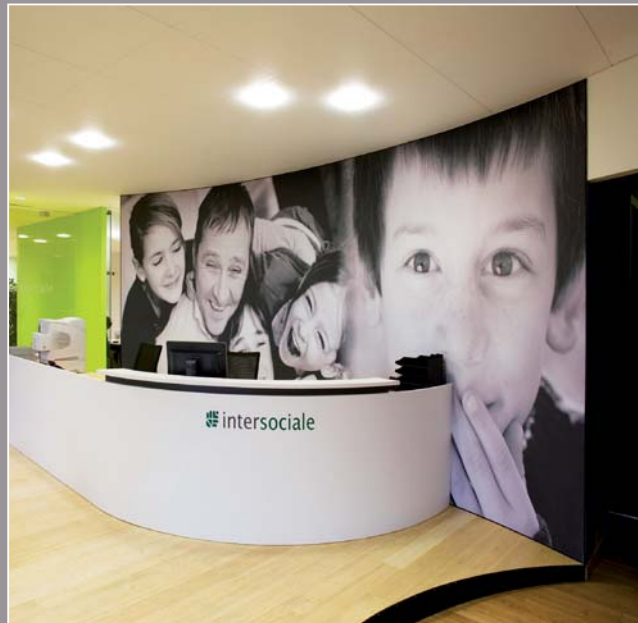
Intersociale de Brussels - Belgique (projet acoustique et imprimé) Architecte : Avanti Design - Réalisation : MonaVisa

De plus, les revêtements clipso sont résistants à l'eau et à la chaleur et sont classés B-s1,d0 (ex M1).