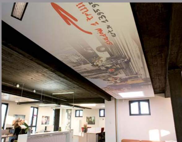
Belgrade-Watson-Deinze - Belgique (plafond imprimé) Réalisation : MonaVisa

CLIPSO Productions 5 rue de l'Église 68 800 Vieux-Thann France