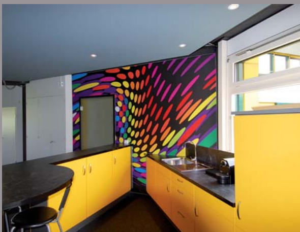
Cuisine de bar - Suisse (plafond standard et mur imprimé) Réalisation : CLIPSO