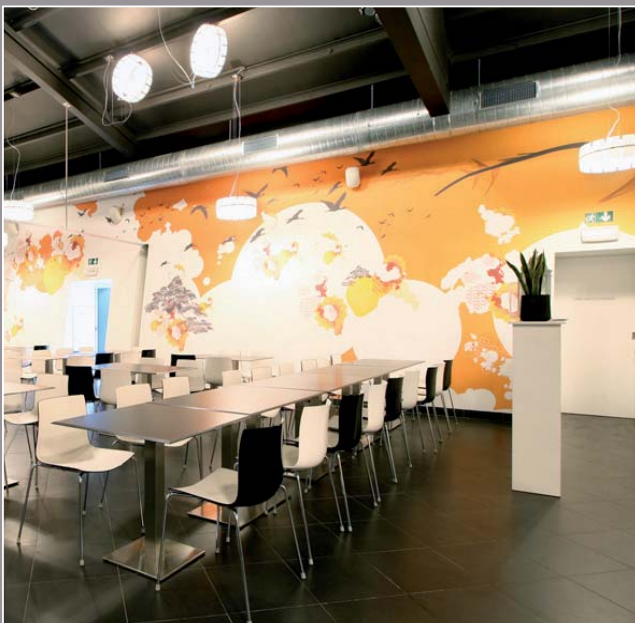
Restaurant Dar Dar de Roeselare - Belgique (projet acoustique et imprimé) - Architecte : Dtonic - Réalisation : MonaVisa

Précurseur dans le domaine de l'impression numérique depuis 2003, clipso possède son propre département clipso design® vous proposant une solution clé en main et à la carte.